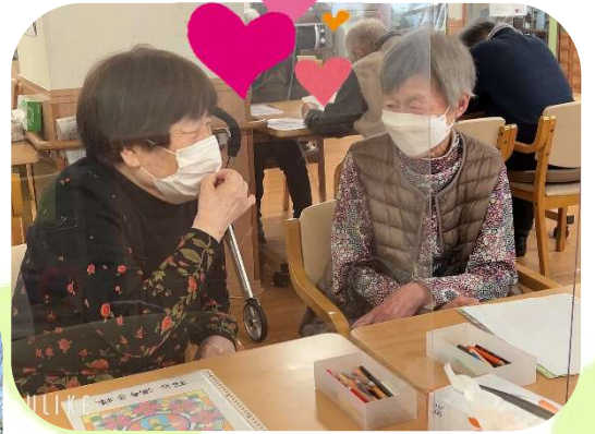
女性同士でお話が尽きません(^▽^)/ 娘時代の話や最近の話をして 大盛り上がり(笑)