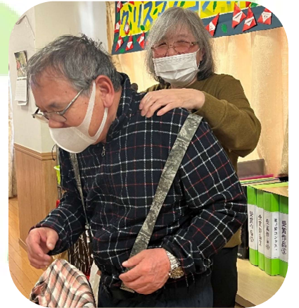
肩もみのしあいっこです(^▽^)/ 日常のあちこちにこのような思いやり が沢山あって職員はほっこりさせても らっています♡嫌がっているわけでは ありませんよ😊

DSでは毎年恒例のお花見ドライブへ出かけました(^▽^)/ 今年は早咲きということで出かけた日は晴天の満開日(^▽^)/ 皆さんの日頃の行いが良いおかげです(^▽^)/ 桜の下で皆さんいい顔してくださっています(^▽^)/